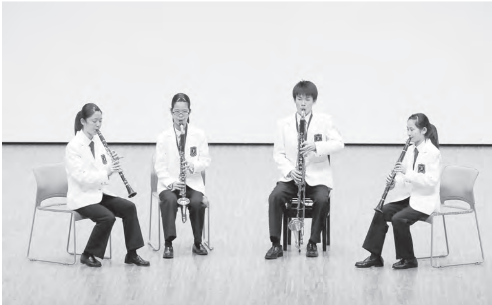
中学校の部 南砺市立福野中学校 クラリネット四重奏 【北陸：金賞】 【中日重奏本大会： 金賞・実行委員長賞】