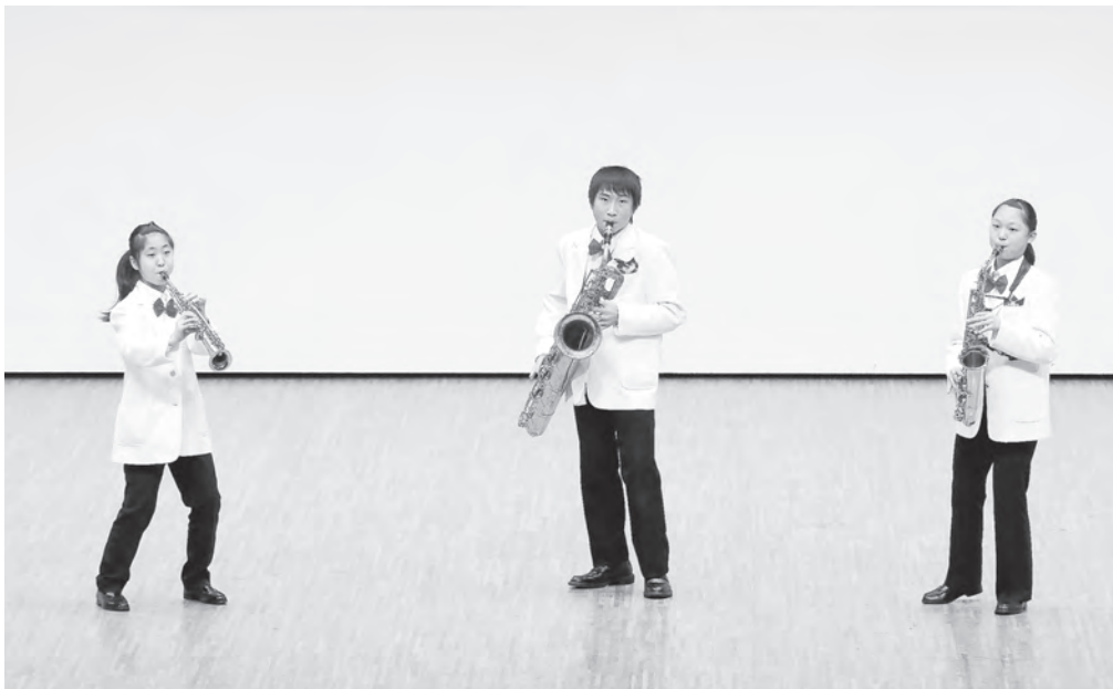
中学校の部 射水市立小杉中学校 サクソフォン三重奏 【北陸：銅賞】 【中日重奏本大会：銀賞】