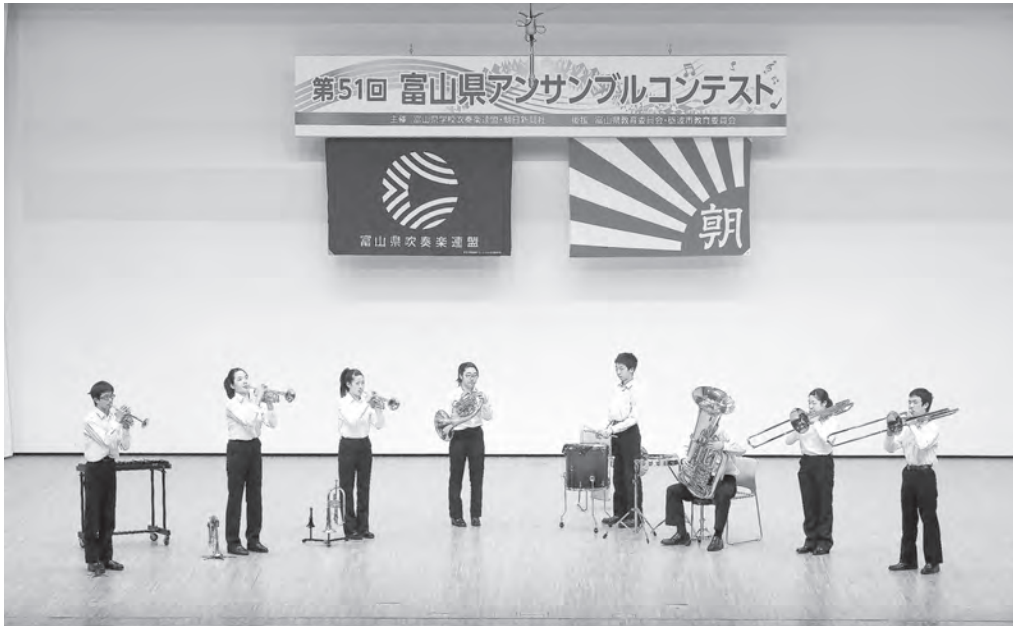
中学校の部 高岡市立芳野中学校 金管八重奏 【北陸：銀賞】