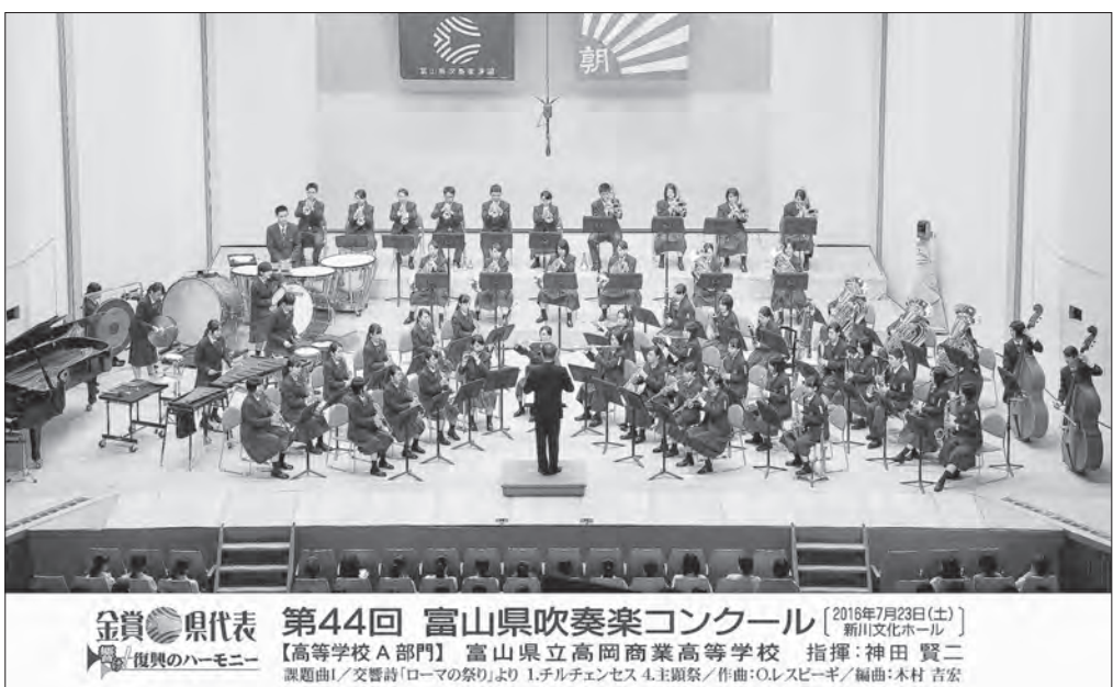
【北陸：金賞・支部代表】 【全日本：銅賞】