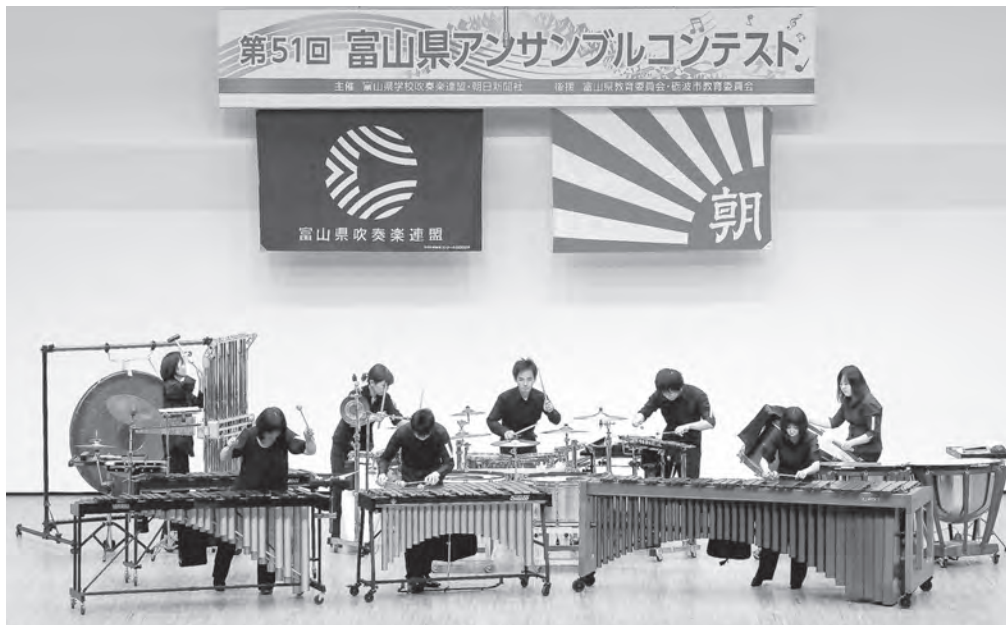
職場・一般の部 なんと！吹奏楽団 打楽器八重奏 【北陸：金賞・支部代表】 【全日本：銀賞】