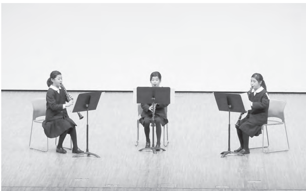
小学校の部 富山大学人間発達科学部 附属小学校 クラリネット三重奏 【北陸：金賞】