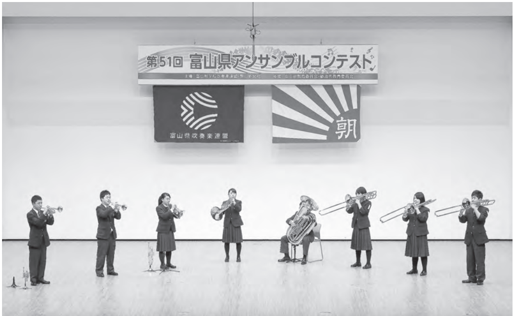
高等学校の部 富山県立高岡商業高等学校 金管八重奏 【北陸：金賞】 【中日重奏本大会：金賞】