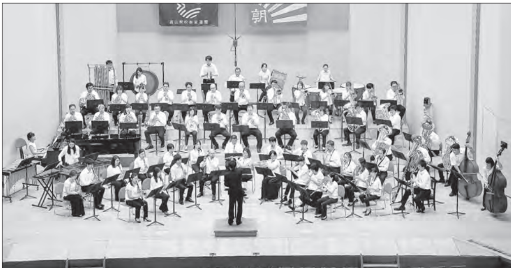
金賞 県代表 第44回 富山県吹奏楽コンクール [2016年7月24日(日)] 新川文化ホール 【職場・一般部門】 速星☆Friday's 指揮：鈴木 和幸 課題曲Ⅰ / フェスティバル・ヴァリエーション / 作曲：C.T. スミス