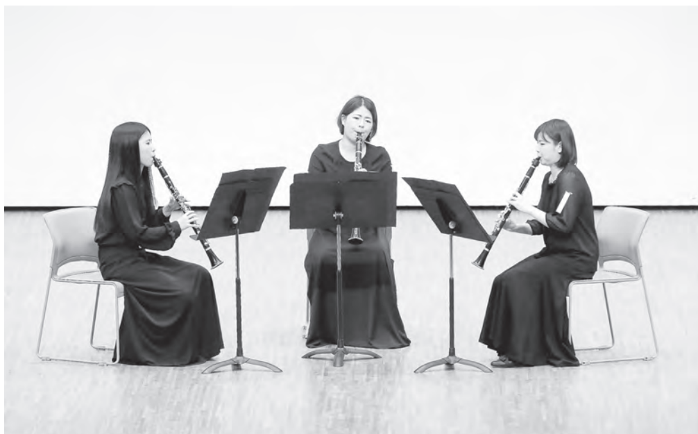
職場・一般の部 なんと！吹奏楽団 クラリネット三重奏 【北陸：銀賞】 【中日重奏本大会： 金賞・理事長賞】