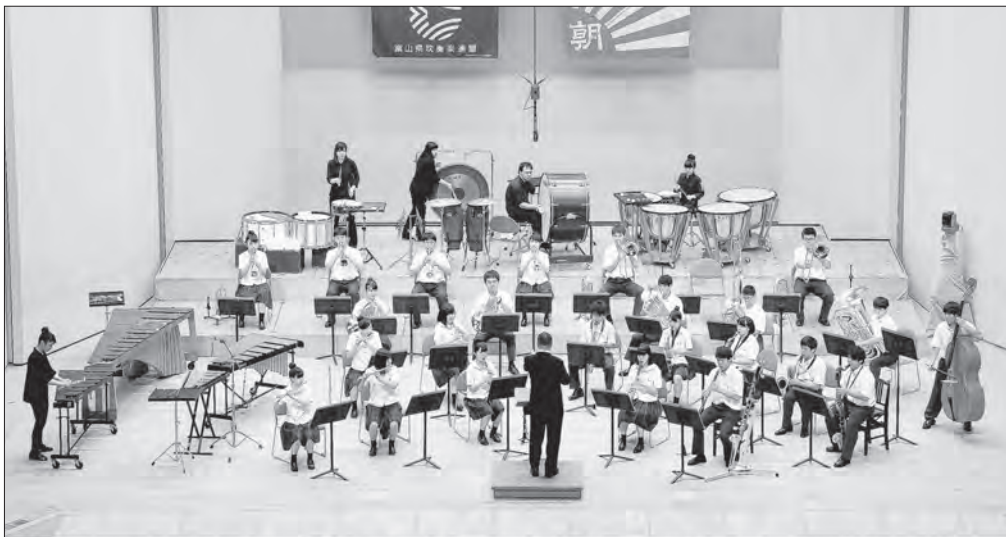
金賞 県代表 第44回 富山県吹奏楽コンクール [2016年7月23日(土)] 新川文化ホール 【高等学校B部門】 富山県立富山工業高等学校 指揮：加藤 祐行 パレ組曲「シバの女王ベルキス」より I.ソロモン、2.戦いの鐘、3.狂宴の踊り/作曲：O.レスピーギ/編曲：小長谷宗一