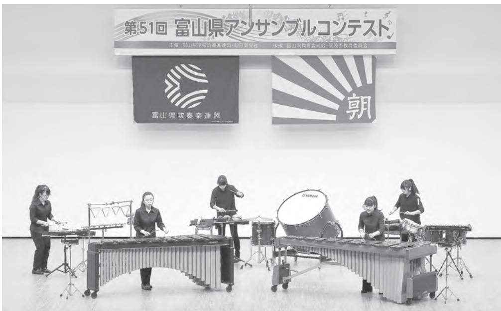
高等学校の部 富山県立富山高等学校 打楽器五重奏 【北陸：銀賞】