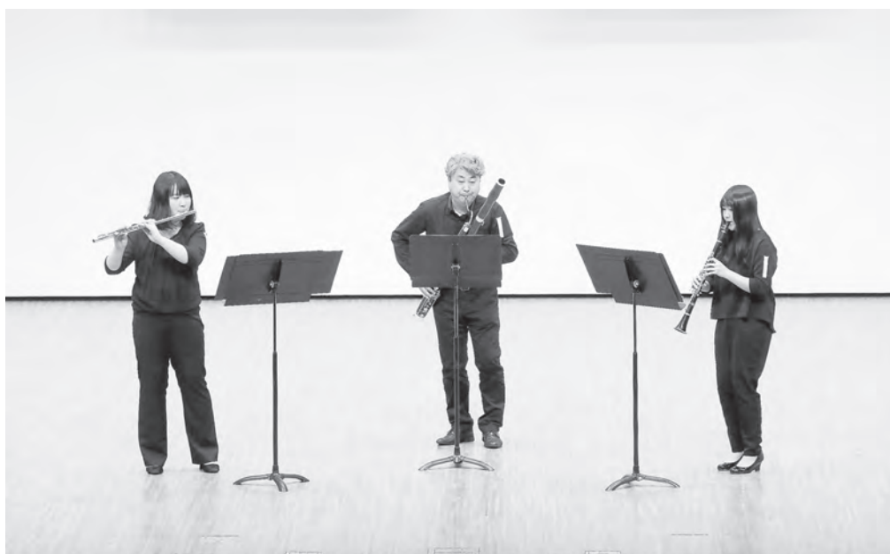
職場・一般の部 ムジカグレート氷見 木管三重奏 【北陸：金賞】