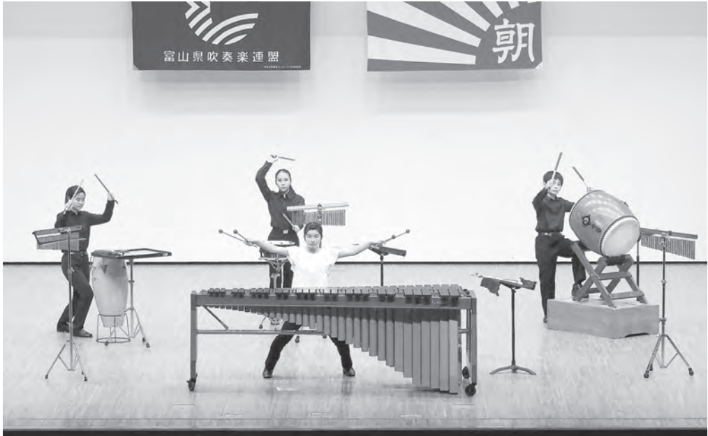
中学校の部 入善町立入善西中学校 打楽器四重奏 【北陸：銀賞】