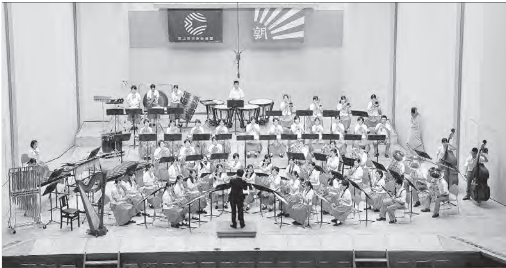
金賞 県代表 第44回 富山県吹奏楽コンクール [2016年7月23日(土)] 新川文化ホール 【高等学校 A 部門】 富山県立富山商業高等学校 指揮: 鍛冶 伸也 課題曲 I / 秋ふたたび / 作曲: 長生 淳