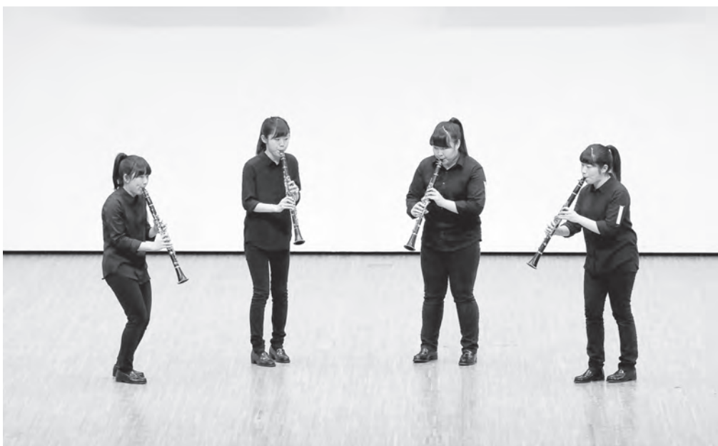
高等学校の部 富山県立魚津高等学校 クラリネット四重奏 【北陸：金賞】 【中日重奏本大会： 金賞・理事長賞】