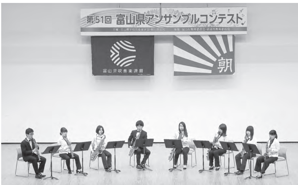
大学の部 富山大学吹奏楽団 サクソフォン八重奏 【北陸：金賞・支部代表】 【全日本：銀賞】