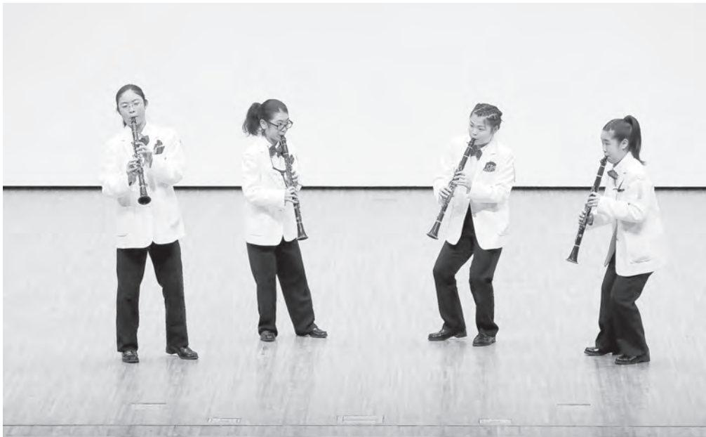
中学校の部 射水市立小杉中学校 クラリネット四重奏 【北陸：金賞・支部代表】 【全日本：金賞】