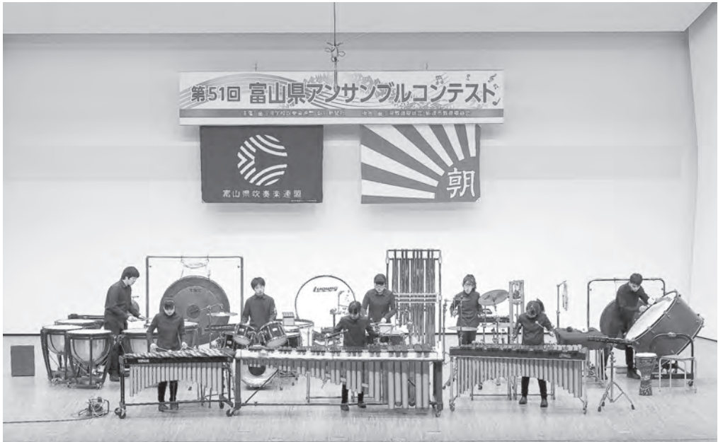
中学校の部 富山市立速星中学校 打楽器八重奏 【北陸：金賞】 【中日重奏本大会：金賞】