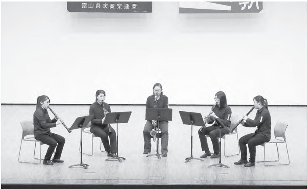
高等学校の部 富山県立新湊高等学校 クラリネット五重奏 【中日重奏本大会：銀賞】