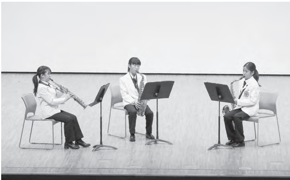
小学校の部 高岡市立野村小学校 サクソフォン三重奏 【北陸：銀賞】