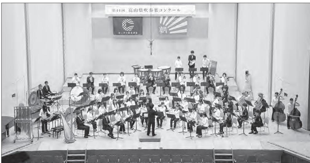
金賞 県代表 第44回 富山県吹奏楽コンクール [2018年7月24日(日) 新川文化ホール] 【大学部門】 富山大学吹奏楽団 指揮: 建部 知弘 課題曲I / 久堅の幹 / 作曲: 長生 淳