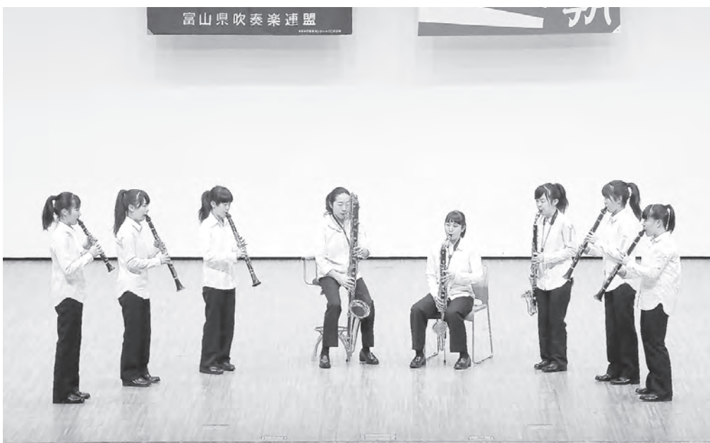
中学校の部 高岡市立芳野中学校 クラリネット八重奏 【北陸：銀賞】