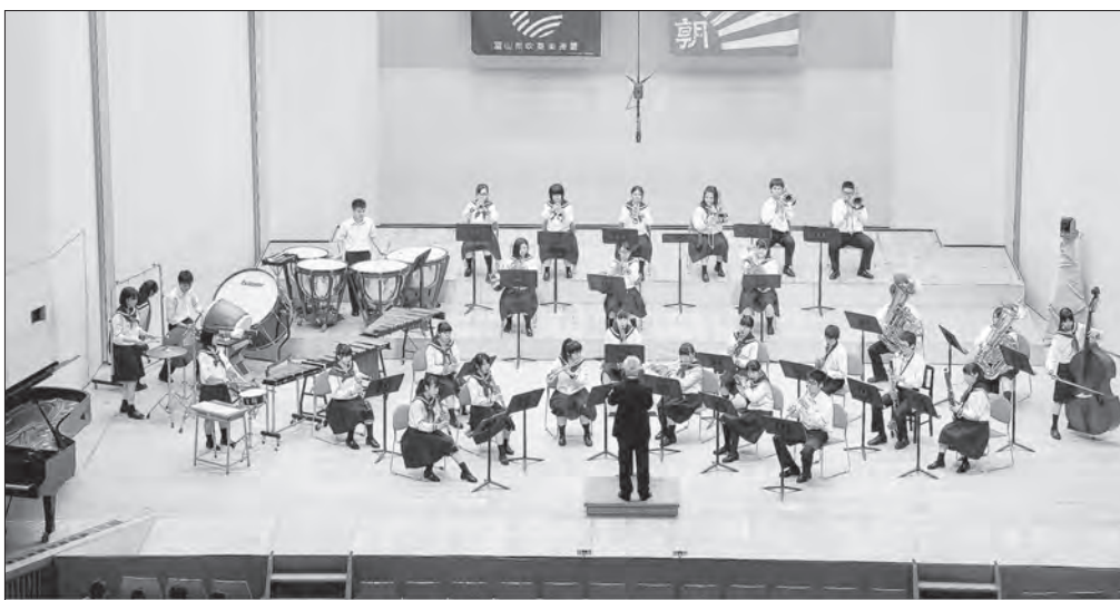
金賞 県代表 第44回 富山県吹奏楽コンクール [2016年7月23日(土)] 新川文化ホール 【高等学校B部門】 富山県立高岡高等学校 指揮：清水 毅 斐伊川に流るるクシナダ姫の涙/作曲：樽屋 雅徳