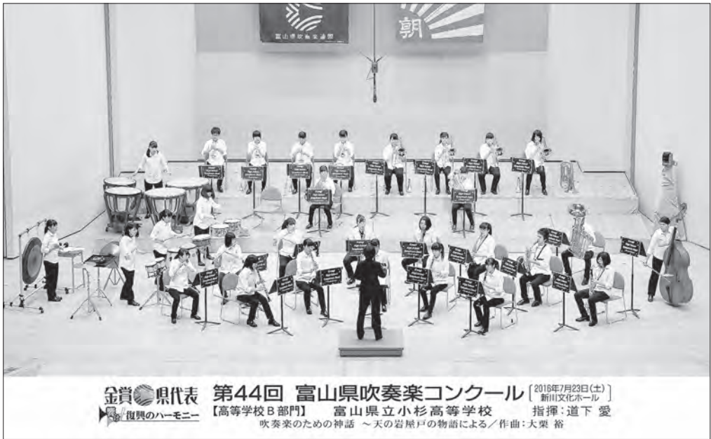
【北陸：金賞・支部代表】 【東日本：銅賞】