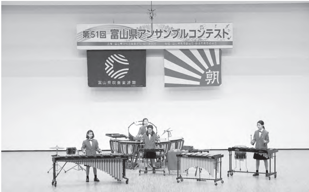
小学校の部 南砺市立福野小学校 打楽器四重奏 【北陸：金賞・最優秀賞】