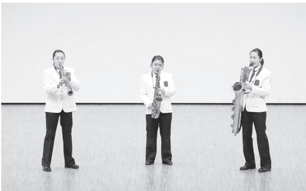
中学校の部 南砺市立福野中学校 サクソフォン三重奏 【北陸：金賞】 【中日重奏本大会：金賞】