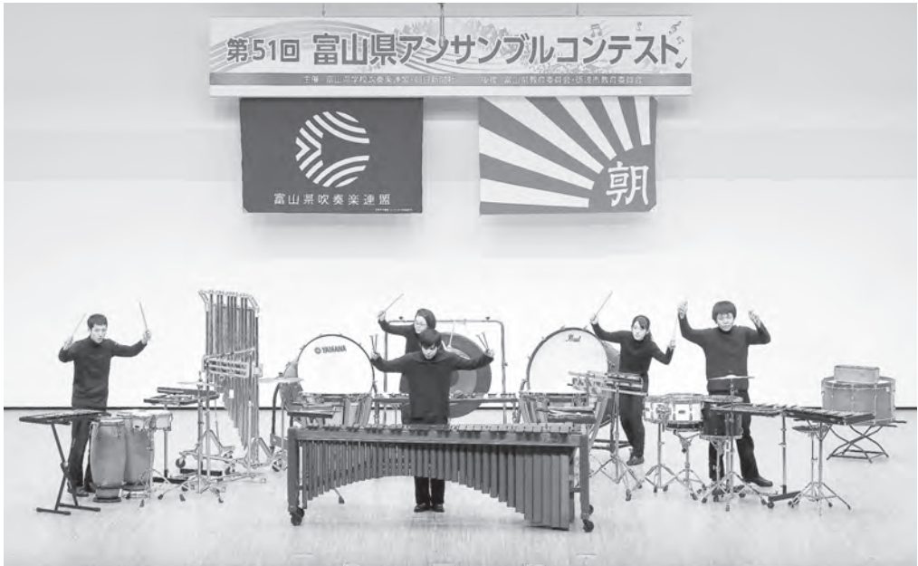
高等学校の部 富山県立富山南高等学校 打楽器五重奏 【北陸：金賞・支部代表】 【全日本：金賞】 【中日重奏本大会：金賞】