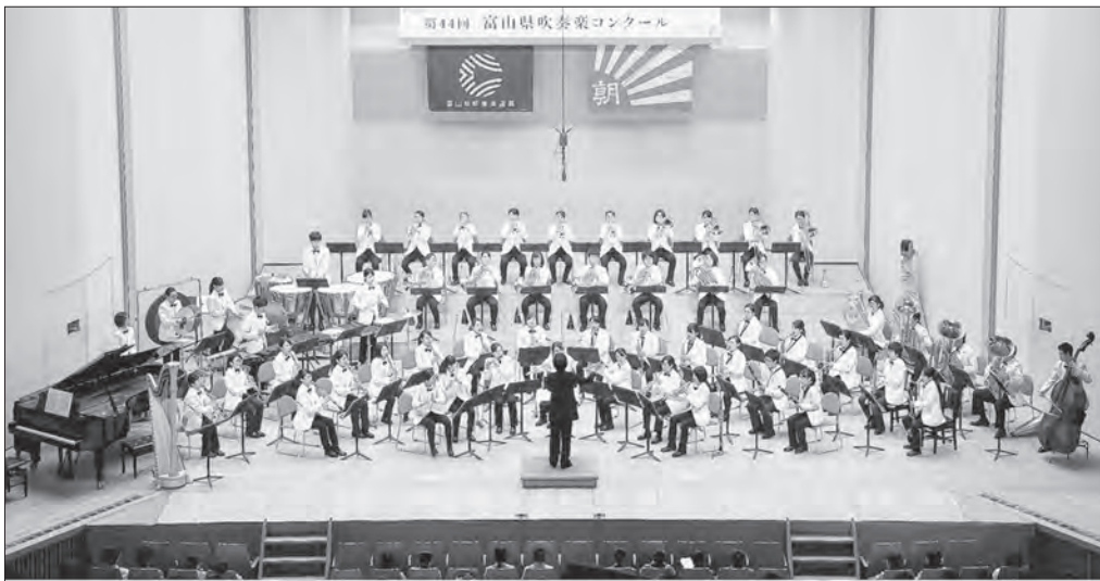
金賞 県代表 第44回 富山県吹奏楽コンクール [2016年7月23日(土)] 新川文化ホール 【高等学校 A 部門】 富山県立富山南高等学校 指揮: 福島久美子 課題曲 IV / バレエ音楽「中国の不思議な役人」 / 作曲: B.バルトーク / 編曲: 斎藤 淳