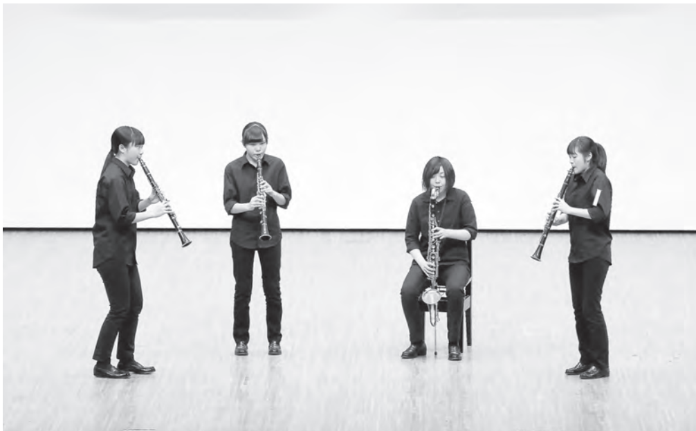
高等学校の部 富山県立小杉高等学校 クラリネット四重奏 【北陸：銀賞】 【中日重奏本大会：銀賞】