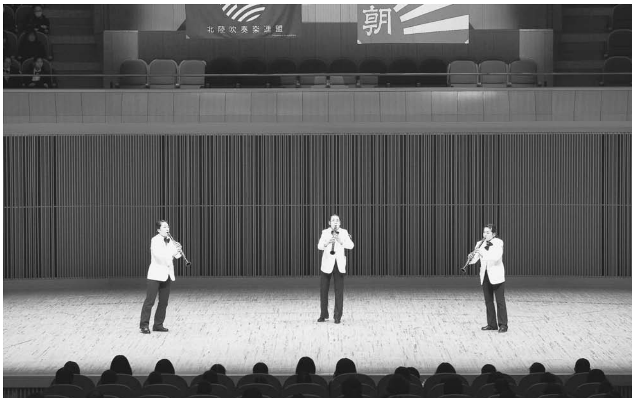
第37回北陸アンサンブルコンテスト中学校の部 2014年（平成26年）2月9日（日）福井県立音楽堂 射水市立小杉中学校 クラリネット三重奏 ※小杉中学校は、北陸支部代表として第37回全日本アンサンブルコンテストに出場し、金賞を受賞