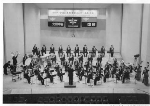
昨年の大会 小松明峰高等学校

高等学校小編成の部・大編成の部 / フェスティバルの部 平成25年10月12日(土) 中学校小編成の部・大編成の部 平成25年10月13日(日) アクティシティ浜松 大ホール