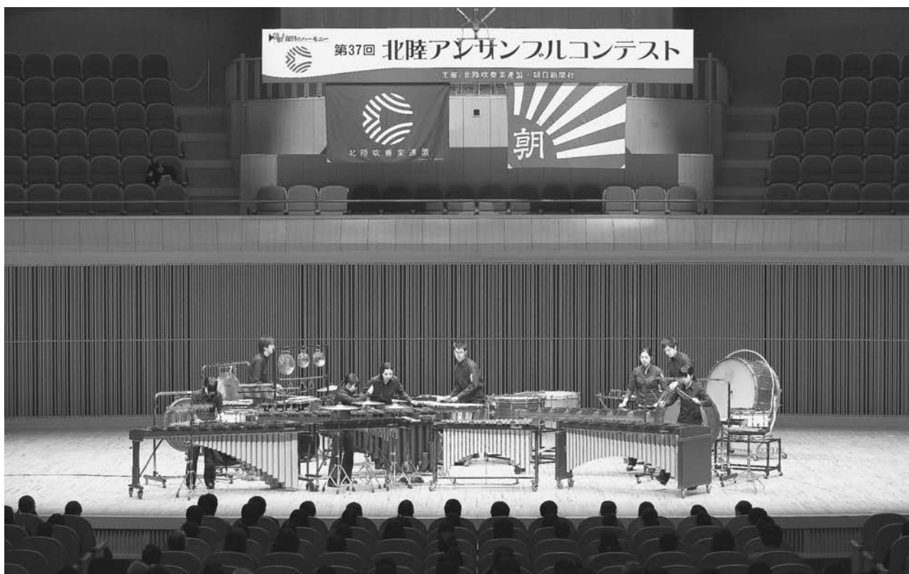
第37回北陸アンサンブルコンテスト職場・一般の部 2014年（平成26年）2月9日（日）福井県立音楽堂 富山ミナミ吹奏楽団 打楽器八重奏 ※富山ミナミ吹奏楽団は、北陸支部代表として第37回全日本アンサンブルコンテストに出場し、銀賞を受賞