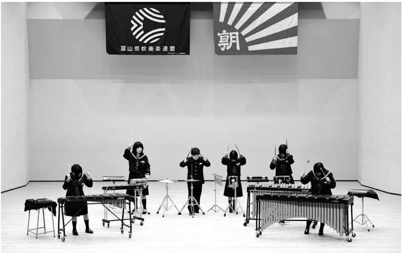
第44回富山県アンサンブルコンテスト中学校の部 2010年（平成22年）1月30日（土）新川文化ホール 高岡市立志貴野中学校 打楽器六重奏 志貴野中学校は、第22回管楽器個人、重奏コンテストに富山県代表として出場。優良賞を受賞