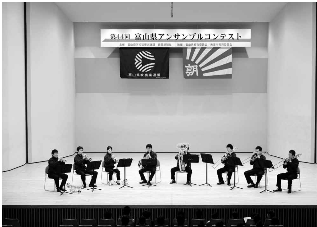
第44回富山県アンサンブルコンテスト一般の部 2010年(平成22年)1月30日(土)新川文化ホール