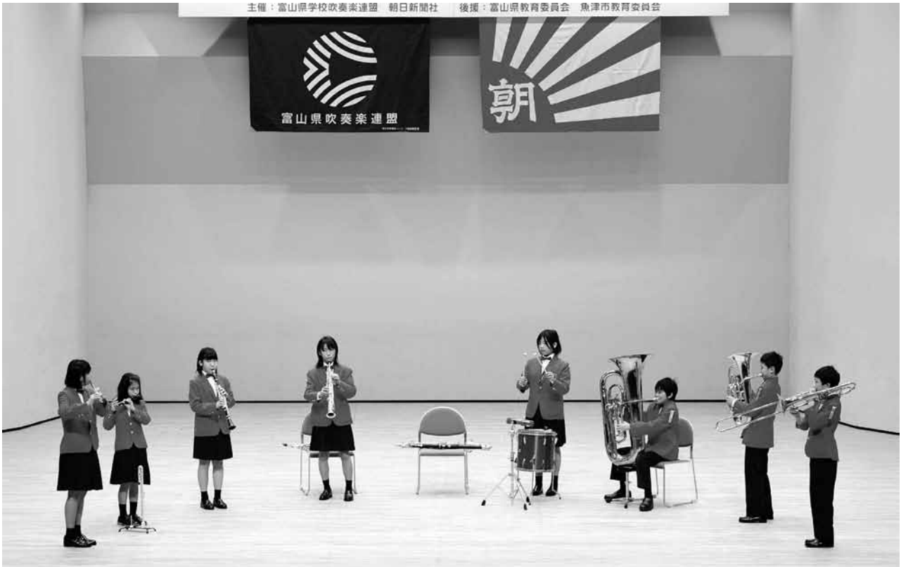
第44回富山県アンサンブルコンテスト小学校の部 2010年（平成22年）1月30日（土）新川文化ホール 南砺市立福野小学校 混成八重奏 福野小学校は、第22回管楽器個人、重奏コンテストに富山県代表として出場。優秀賞を受賞